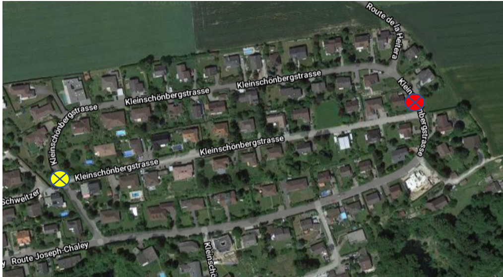
Kleinschönberg-Quartier, Gemeinde Tafers – Haltestellen Schulbus